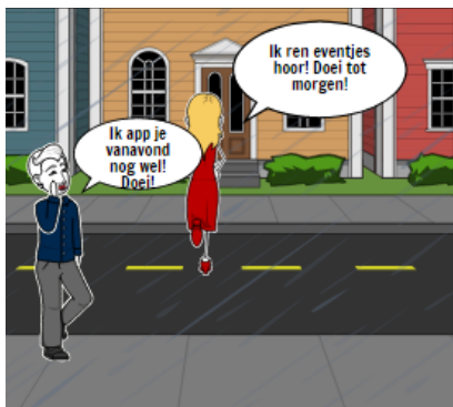
Inmiddels is het gaan regenen ...