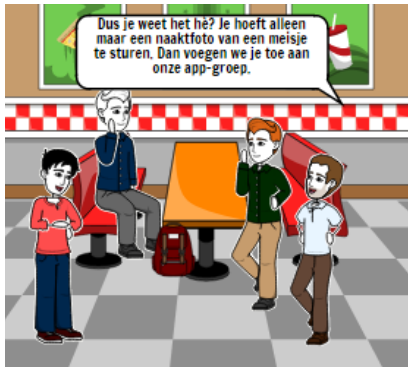
In de pauze bij de snackbar ...

Lees onderstaand stripverhaal en beantwoord de vragen.