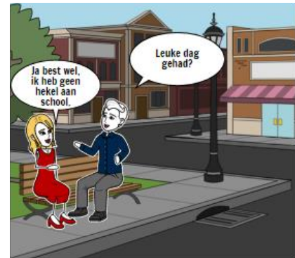
Na schooltijd, met een vriendin