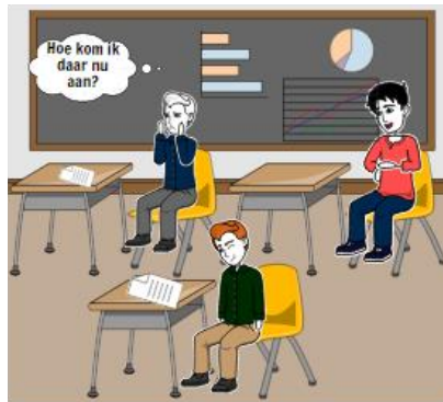
... later tijdens de wiskundeles