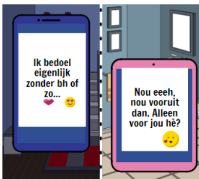
Het gesprek gaat verder ...