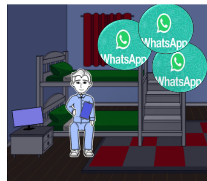
Diezelfde avond ...